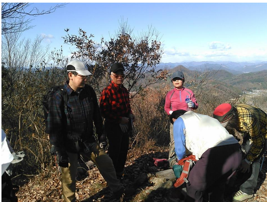
写真は 上) 大明神山 山頂風景