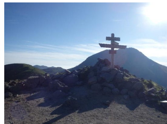
前白根山より本白根を望む