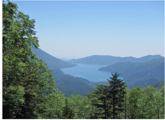
中禅寺湖が見える