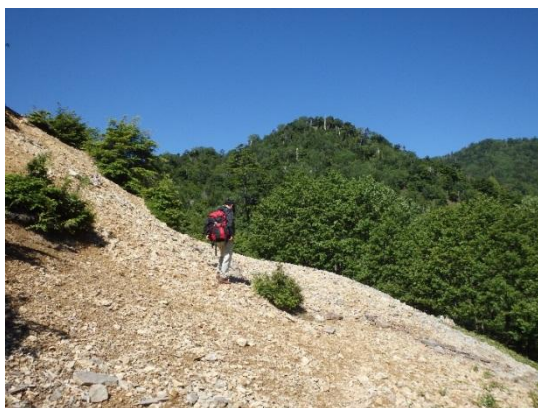
県境尾根はもう少し