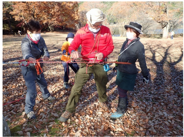
レイジング1対1のやり方を実習