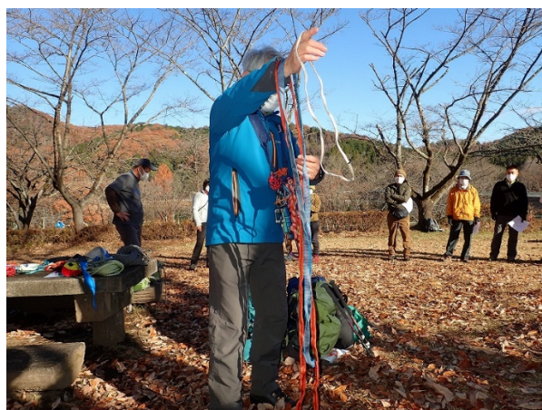
スリングとロープの説明