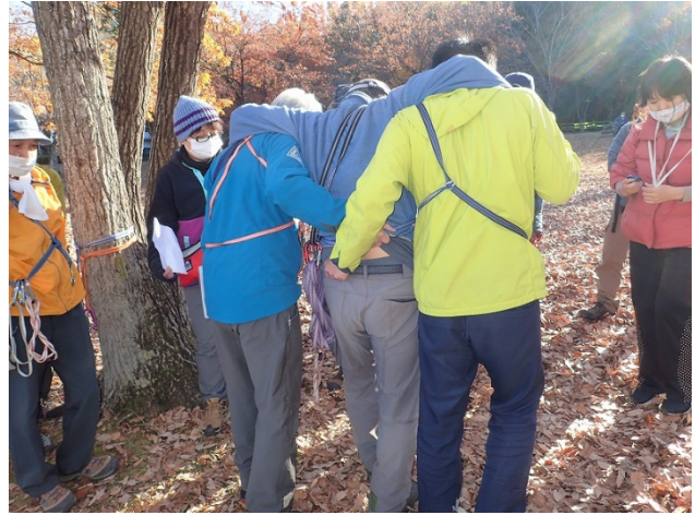
二人による支持搬送