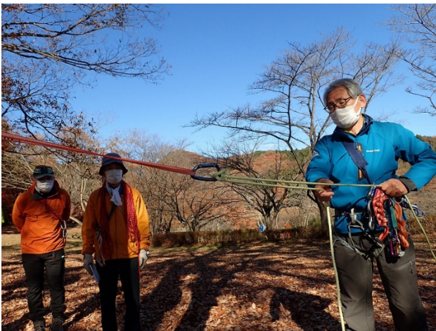
ムンターヒッチの結び方