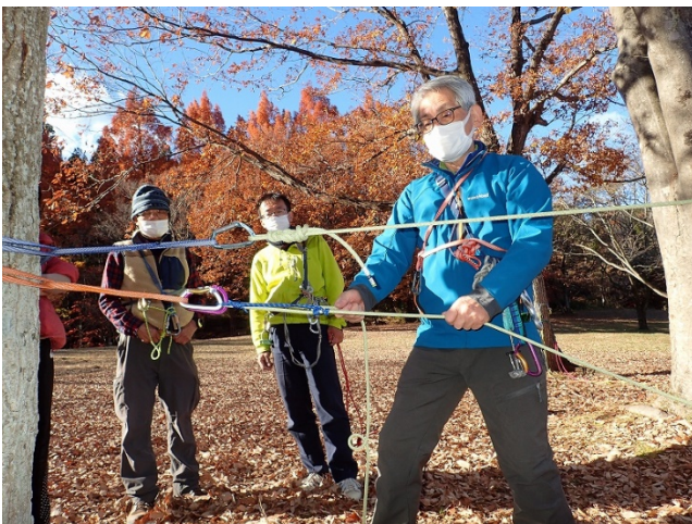
レイジング2対1のやり方