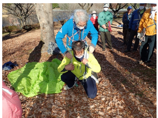
ロープを使った一人による背負い搬送