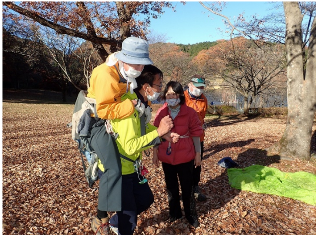
空のザックを逆さに使った一人による搬送