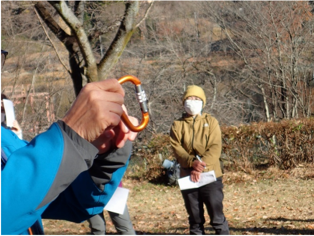
安全環付カラビナの説明