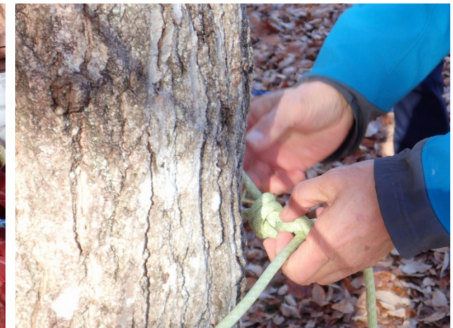
ボウラインノット(もやい結び)の結び方