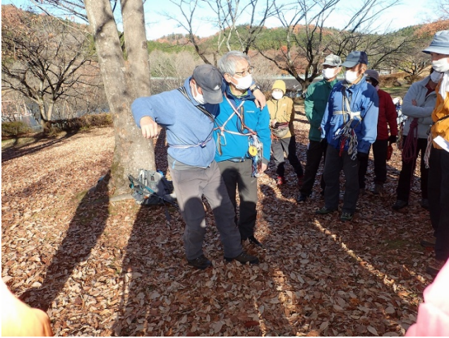
一人による支持搬送