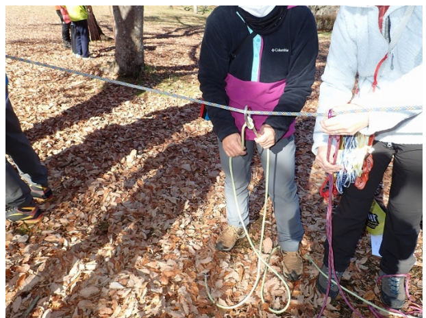
クローブヒッチの結び方の実習