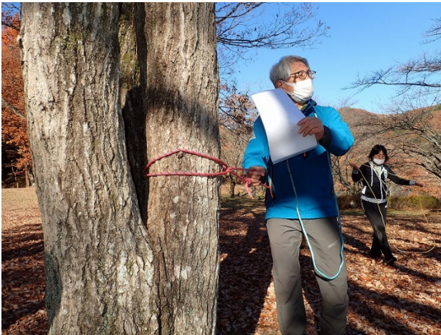
ガースヒッチの結び方