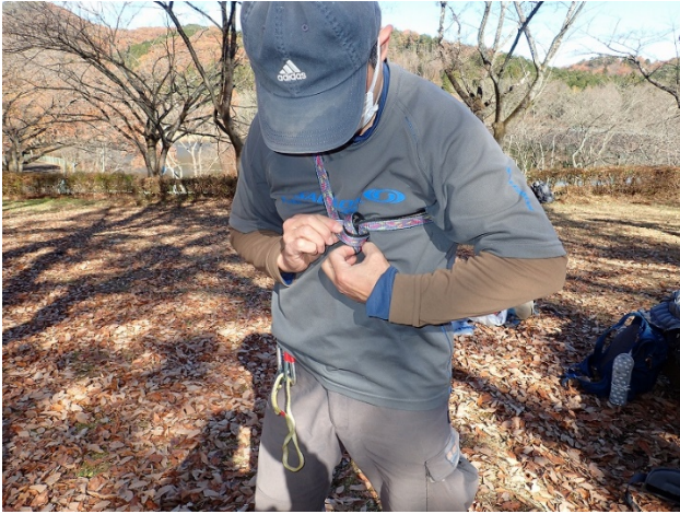
チェストハーネス(シートベルト)の結び方の実習