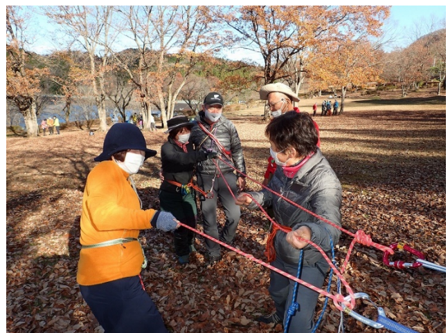
レイジング2対1のやり方を実習