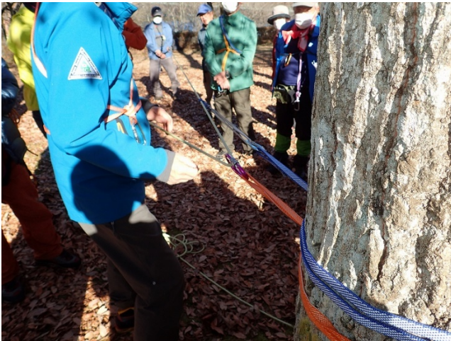
レイジング1対1のやり方