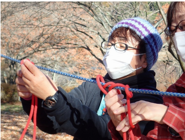
プルージックの結び方を実習