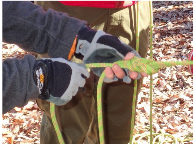
フィギアエイトノットの結び方の実習