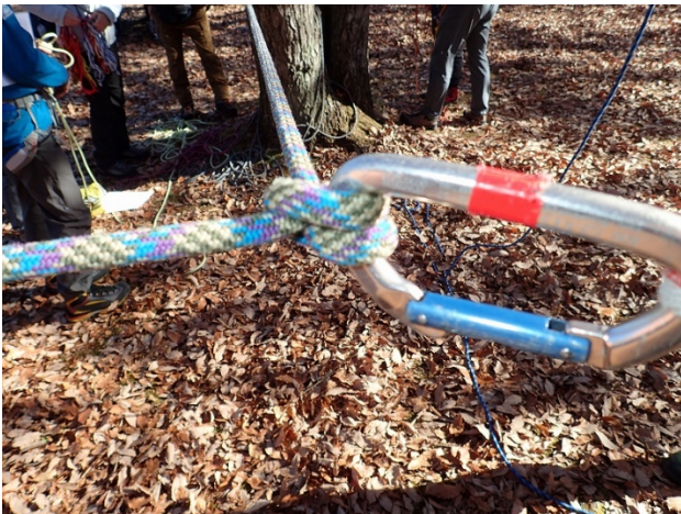
クローブヒッチの結び方