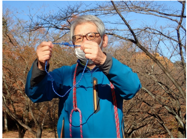
ダブルフィッシャーマンズノットの結び方