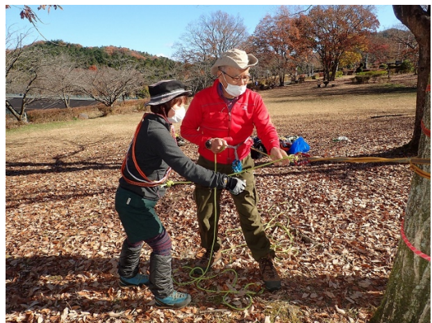
ムンターヒッチの結び方の実習