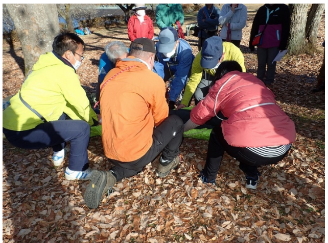
ツェルトとストックを使った簡易担架6人による搬送