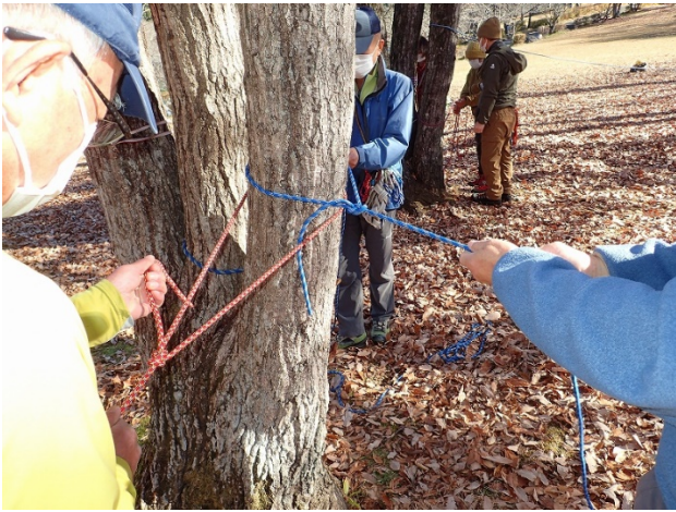
ボウラインノット(もやい結び)の実習