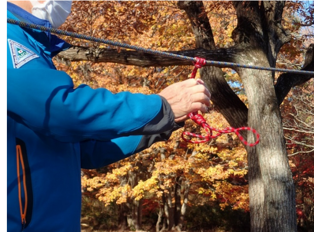
プルージックの結び方