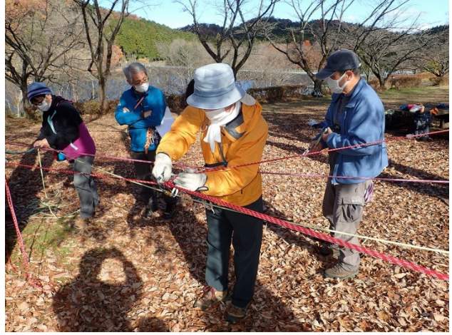
固定ロープの張り方の実習