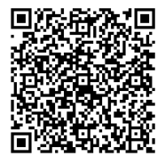
火山登山者向けの 情報提供ページ

(噴火速報の説明： https://www.data.jma.go.jp/svd/vois/data/tokyo/STOCK/kaisetsu/funkasokuho/funkasokuho_toha.html )