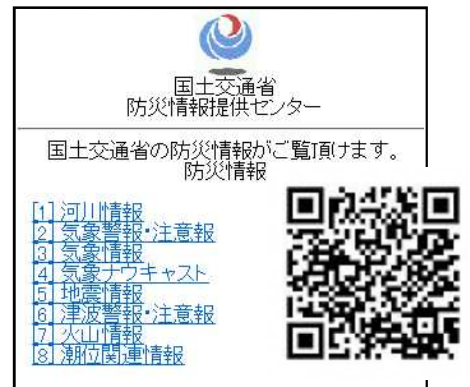
防災情報提供センター 携帯端末向けホームページ (Top)