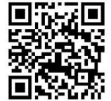
気象庁ホームページ

警報・注意報、危険度分布、天気予報の他、地上・高層天気図、気象衛星、アメダス、気象レーダー、windプロファイラ（上空の風）等の様々な情報を確認することができます。 https://www.jma.go.jp/jma/index.html